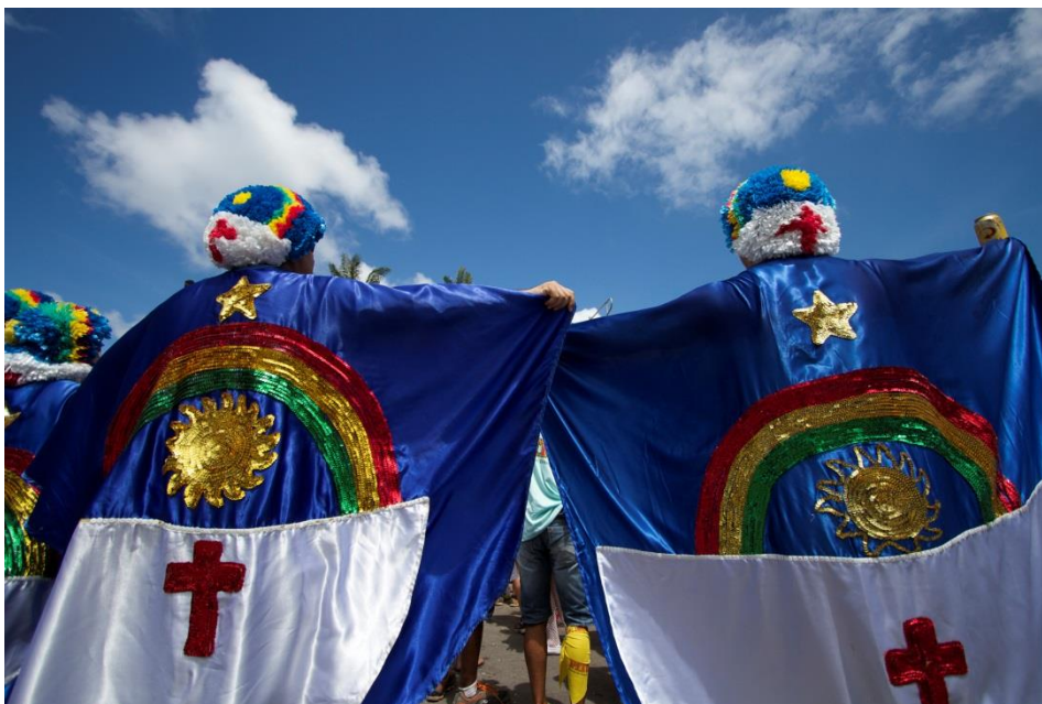
Fotografia: Carnaval de rua em Recife (PE)