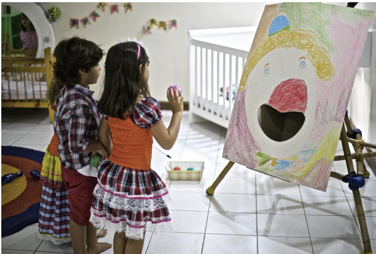
Fotografia: Brincadeira típica de São João - creche privada de Salvador (BA)