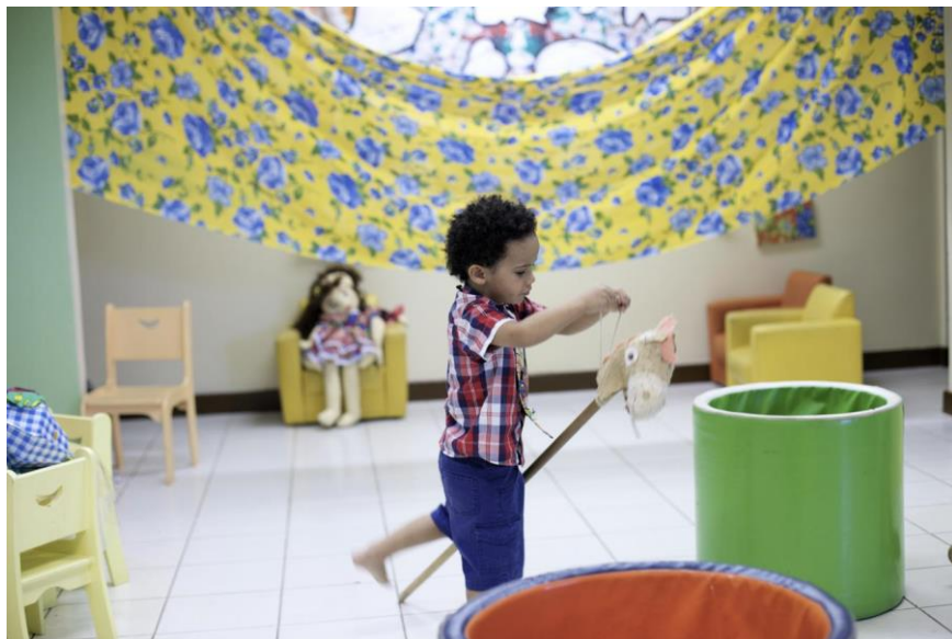
Fotografia: O menino e o cavalinho de pau - creche privada em Salvador (BA)

Brincadeira de cavalgar com cavalinho de pau, feito com cabo de vassoura, bambu ou vara.