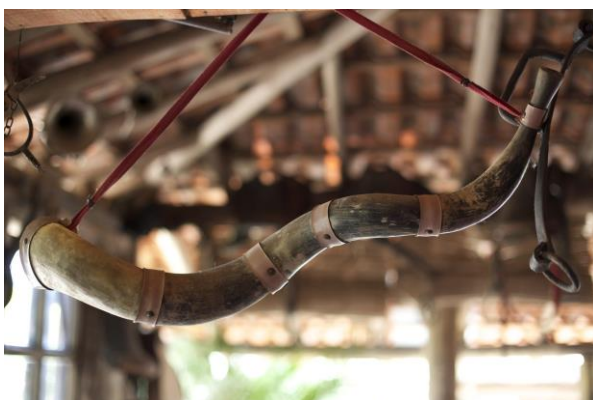
Fotografia: Berrante da região Sudeste