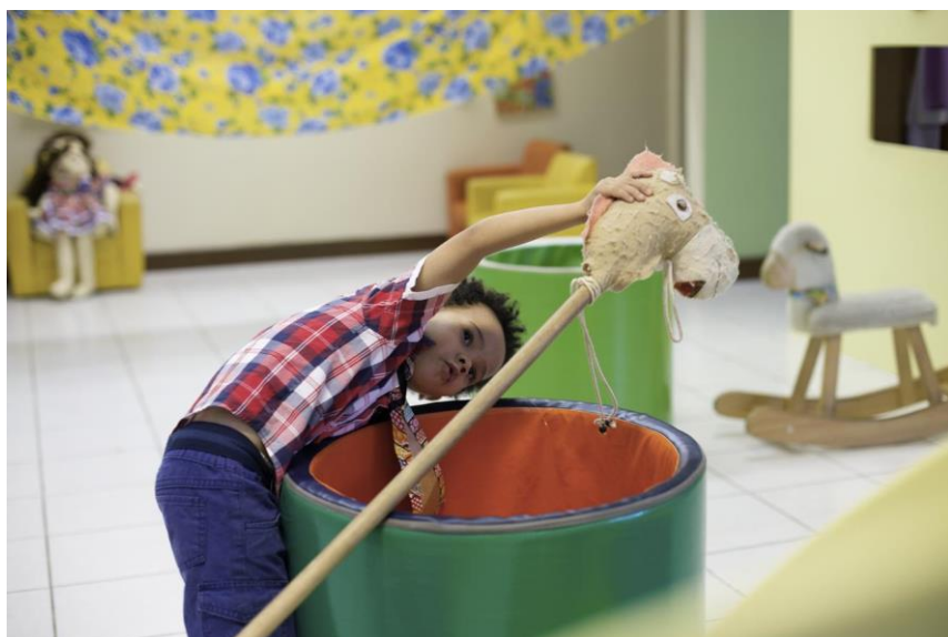
Fotografia: Cavalinho de pau - creche privada em Salvador (BA)