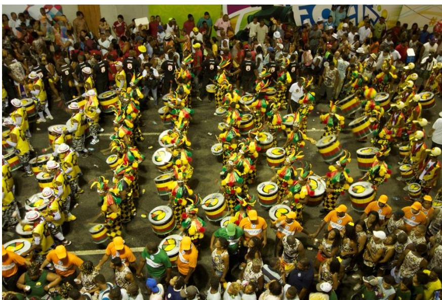
Fotografia: Bloco de Carnaval em Salvador (BA)