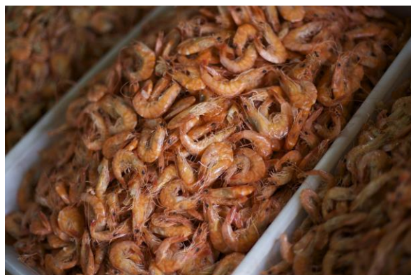
Fotografia: Camarão seco - região Nordeste