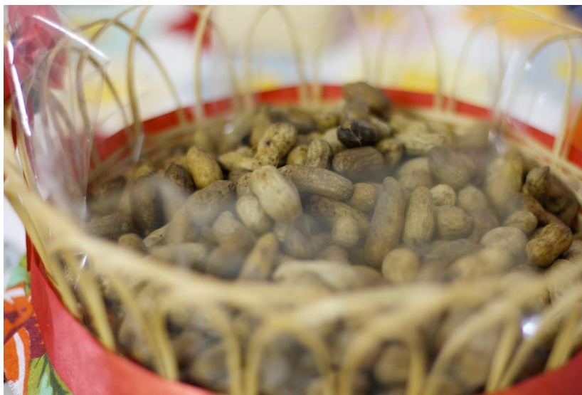
Fotografia: Amendoim cozido, comida típica de São João – creche privada de Salvador (BA)