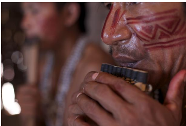
Fotografia: Índio da região Norte

(Educação Infantil – Creche: 0 a 3 anos e 11 meses)