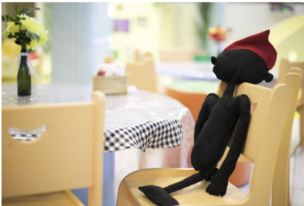
Fotografia: Saci-pererê - creche privada Salvador (BA)

Diz a lenda que o Saci é a representação de um negrinho que perdeu a perna lutando capoeira. Utiliza uma espécie de cachimbo, o pito, e um gorrinho vermelho que lhe confere poderes mágicos. Muito brincalhão, o Saci gosta de se divertir com os animais e com as pessoas, sendo a travessura sua principal característica. Segundo a lenda de origem africana, o Saci está nos redemoinhos de vento e pode ser capturado com uma peneira. Uma vez capturado, deve-se retirar o capuz da criatura para garantir sua obediência e prendê-lo em uma garrafa. Diz também a lenda que o Saci nasce em brotos de bambus, onde vive por sete anos. Depois, vive mais setenta e sete anos provocando e atrapalhando a vida de pessoas e animais, até morrer e virar um cogumelo venenoso ou uma orelha de pau.