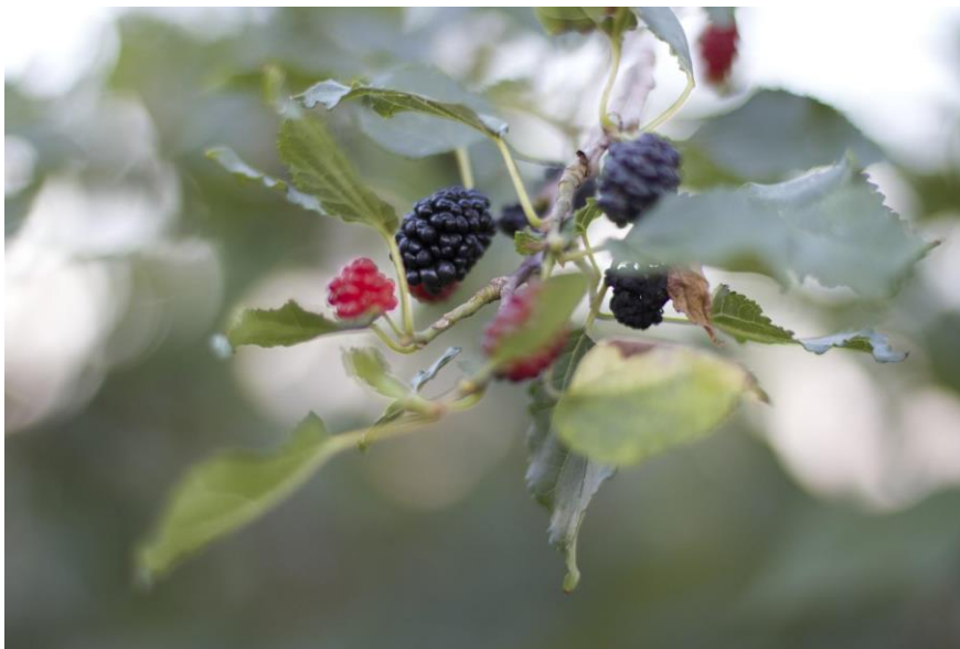
Fotografia: Amora, fruta típica de região Sudeste