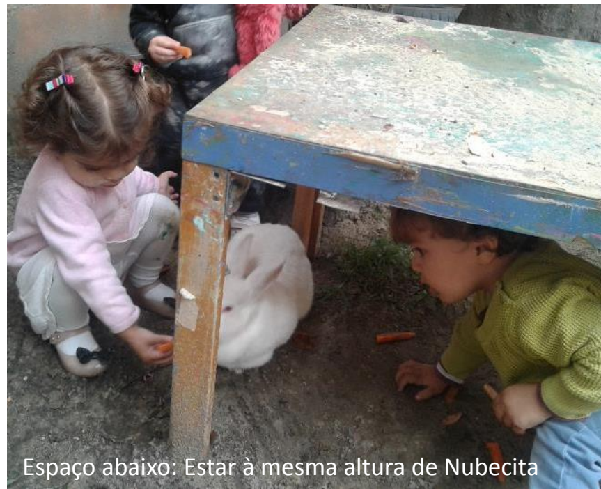
Espaço abaixo: Estar à mesma altura de Nubecita