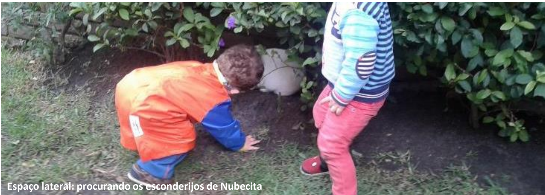
Espaço lateral: procurando os esconderijos de Nubecita