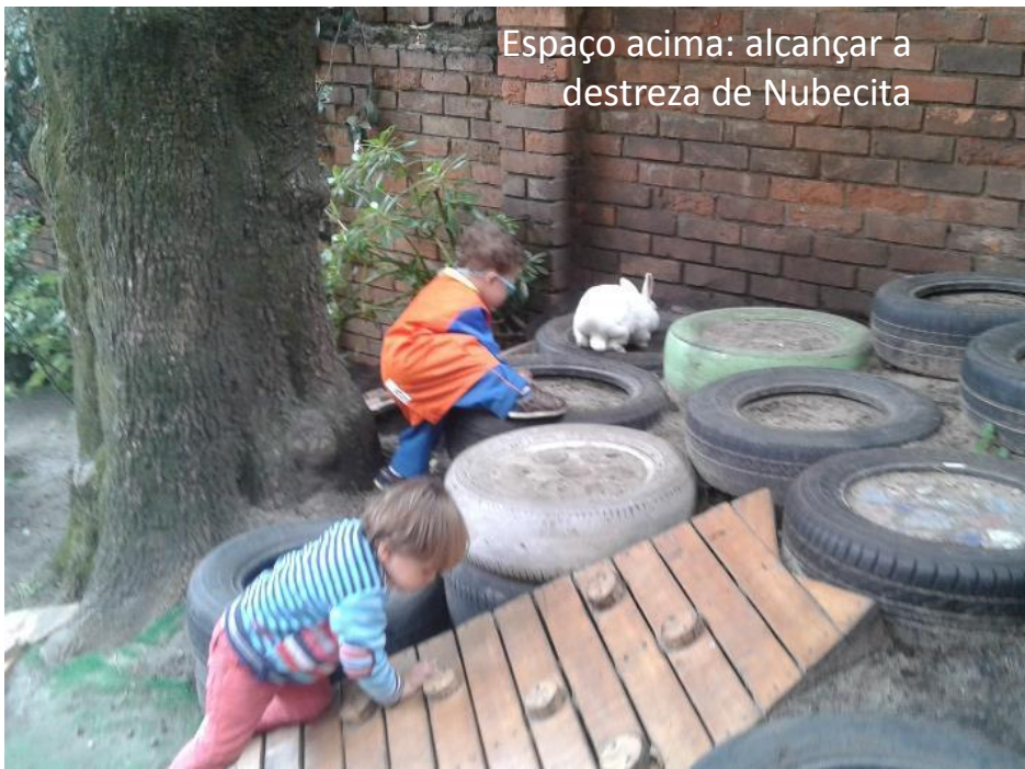
Espaço acima: alcançar a destreza de Nubecita